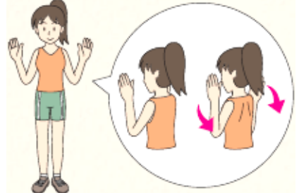
肩甲骨を背中を中心に寄せ3秒から5秒保つ