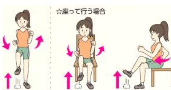
腕を振りながら足踏みする